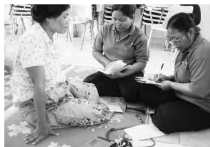
妊婦に対して保健教育を行う実習風景

チェック等、全項目をきちんと記入して、健診カードが活用できるように指導しました。また、妊婦に対して、栄養指導、お産の準備と妊娠中の危険信号(難産の徴候)などを教育できるように練習しました。最終日には、実際に妊婦さんに来てもらい、健診を行い、妊婦さんのための保健教育を行いました。