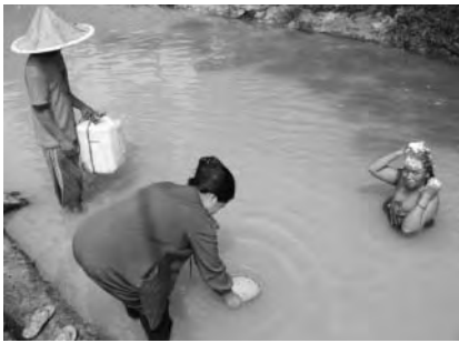
飲用水となる河川(水汲み・食材洗い・洗髪)

また村人の生活では、人々の飲用水の主水源である河川・水路や灌漑池は、トイレ・浴場・洗濯場としても使用され、感染症などの懸念も絶えません。雨水の貯水や浅井戸も使われてはいますが、海に近い影響もあり塩分濃度が非常に高く、火山性の細かい土壌粒子の含有量も多く、長期飲用による健康被害の可能性も見受けられます。地域社会も「安全な