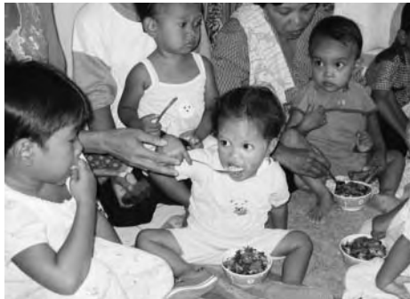
地域保健強化事業で実施している事業の一つ栄養不良幼児への栄養補給食配給

この事業は、現地保健行政と協力して地域医療サービスを改善・向上し、母子健康教育によってお母さんの健