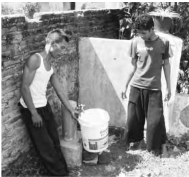
早速貰い水にきました

また村人の生活では、人々の飲用水の主水源である河川・水路や灌漑池は、トイレ・浴場・洗濯場としても使用され、感染症などの懸念も絶えません。雨水の貯水や浅井戸も使われてはいますが、海に近い影響もあり塩分濃度が非常に高く、火山性の細かい土壌粒子の含有量も多く、長期飲用による健康被害の可能性も見受けられます。地域社会も「安全な